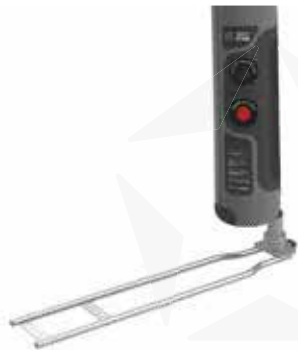
AUTOSTELLFUSS MIT ROTATOR

DANK EINER VIELFALT VON STELFFUSS BASEN KÖNNEN STARX FLAGS AUF DEN VERSCHIEDENSTEN UNTERGRÜNDEN VERWENDET WERDEN.