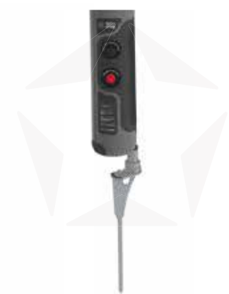
ERDDORN MIT ROTATOR

OPTIONAL SANDGEFÜLLTE GEWICHTE ZUR ERHÖHUNG DER STABILITÄT DES KREUZFUSSES. ERHÄLTLICH IN VERSCHIEDENEN VARIANTEN FÜR JEDES STARX FAHNENMODELL.