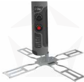
KREUZFUSS MIT ROTATOR

SCHWENKFUSS FÜR DIE VERWENDUNG MIT FAHRZEUGEN. EINFACH AUF DIE BASIS MIT DEM RAD EINES AUTOS FAHREN, UND SO EINE STABILE UND WIRKSAME POSITION DER FAHNE ERHALTEN.